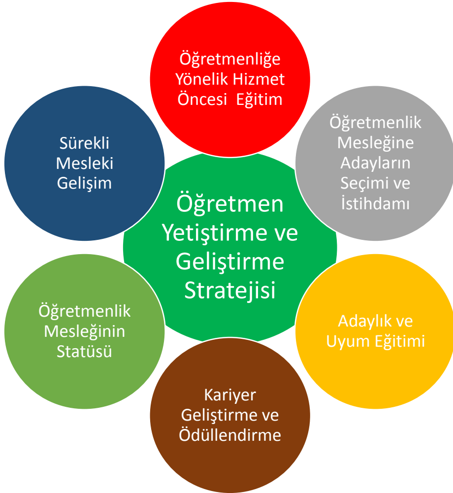
Şekil 1. Öğretmen Strateji Belgesi Ana Temalar

Öğretmen strateji belgesinde öğretmenlik mesleğine yönelik politikaların geliştirilmesi için, gerek öğretmenlik mesleğine ilişkin süreçler gerekse temel sorun alanları göz önünde bulundurularak 6 ana tema belirlenmiştir. Belgede yer alan amaç, hedef ve eylemler Şekil 1’de yer alan ana temalar dikkate alınarak oluşturulmuştur.